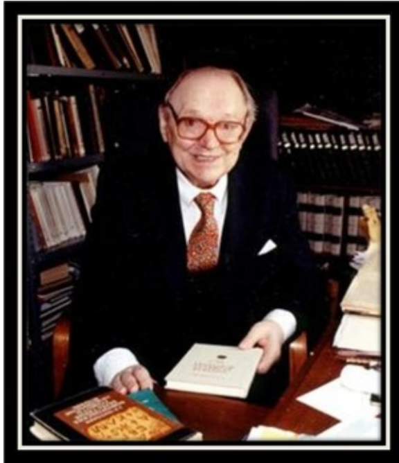
Омельян Йосипович Прицак (1919–2006)

Іншим радянським дослідникам ця праця залишилась невідомою, попри те, що ні Київський лист, ні Кембріджський документ не були перекладені російською, та не публікувались у вітчизняних виданнях [3], с. 195—196].