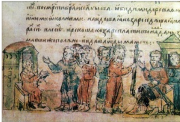
Поляни сплачують данину хозарам. Мініатюра з Радзивілівського літопису (XV ст.)

зазначаючи, що автор часто сам плутається у свої твердженнях, та оперує ненадійними матеріалами археології та топографії. На його думку Київ виникає як типове слов'янське поселення і продовжувати суперечки про його етнічну приналежність просто немає сенсу [17, с. 101–107].